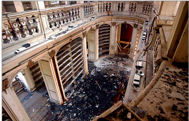
Rokoko-Saal der Herzogin-Anna-Amalia-Bibliothek nach dem Brand

Besondere Aufmerksamkeit verdienen zunächst die terminologischen Unterschiede, wenn man es mit der „Elektronischen Archivierung“ zu tun hat. In der Sprache der Informationsspezialisten und der Archivare umfasst der Begriff „Archivierung“ völlig andere Dimensionen. Die IT-Welt geht dabei von einem Zeitraum von 10 Jahren, bestenfalls von wenigen Jahrzehnten aus. Archivare haben bei ihrer Tätigkeit die Ewigkeit im Blick. Die IT-Welt beglückt uns in immer kürzeren Zyklen mit Innovationen, während sich die Fachleute in den Archiven bemühen, die Daten für die Nachwelt lesbar und authentisch zu sichern. Man wird sich der digitalen Revolution nicht ernsthaft in den Weg stellen wollen, trotzdem sei die Überlegung gestattet, ob der digitale Zeitgeist in jedem Fall einen Gewinn bringt.